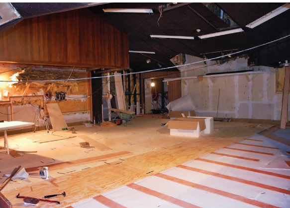
Regufoam in de Wisseloord studio's te Hilversum